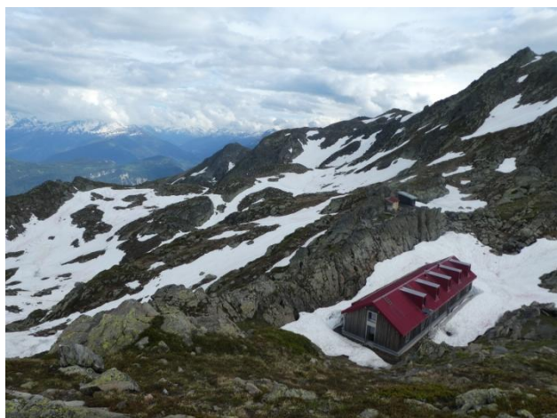
Cabane du Demècre (2361m)

Montagn'art poursuit son chemin artistique avec une exposition du 29 juin au 28 septembre 2019 à la cabane du Demècre. Depuis 2001 une dizaine d'expositions ont été organisées à la cabane du Demècre, et autant d'artistes ont porté leurs œuvres dans leur sac à dos, jusqu'à la cabane située à 2361m d'altitude. Celle-ci a accueilli graveurs, peintres, sculpteurs, photographes, musiciens, biologistes, cuisiniers, vigneron, pour y composer des tableaux à ciel ouvert. Occasions multiples de regards partagés.